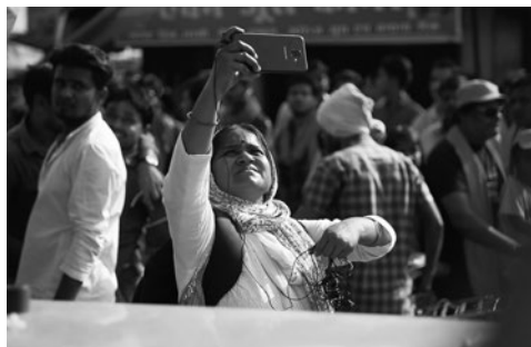
© BLACK TICKET FILMS. ALL RIGHTS RESERVED.

※フリースペース有り・・・休憩中に持ち込みのお食事を食べていただけるお部屋をご用意しております。(飲食物の販売はございません) 全席自由・入替制 ※開場は上映時刻の各30分前