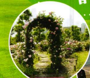
フラワーガーデン