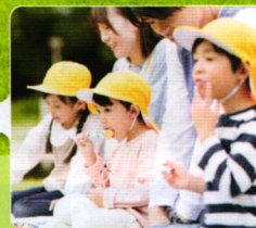
学校行事・遠足・昼食利用