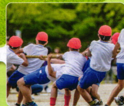
お祭り・運動会など地域行事

※公共の福祉、公序良俗に反することはできません。 ※花火や危険な球技、動物を放すことはできません。 ※ご利用主体は、主に一般企業・NPO法人や自治会(老人会)・ボーイスカウト・学校園等地域団体・公共団体などを想定しています。個人営業の営利目的行為はお控えください。 ※「芝生広場」以外の「フラワーガーデン」「海づり広場」をご利用の場合、料金が発生するケースがあります。 ※その他申請内容によってお断りする場合があります。詳しくは公園管理事務所までお問い合わせください。