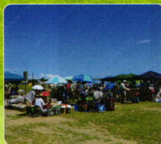
バル・マルシェ・フリーマーケット